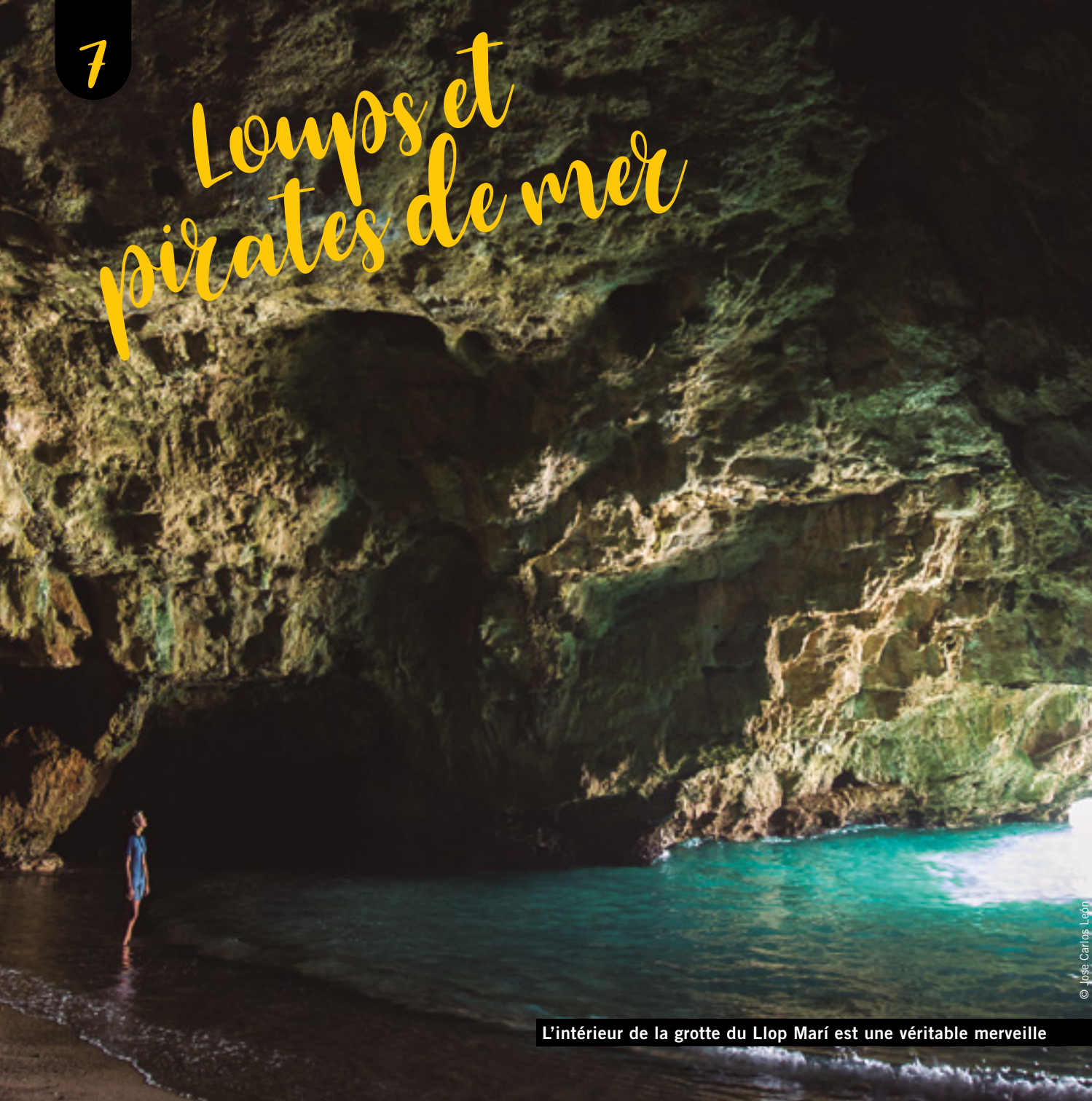
L'intérieur de la grotte du Llop Marí est une véritable merveille