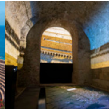
Volta del Pallol