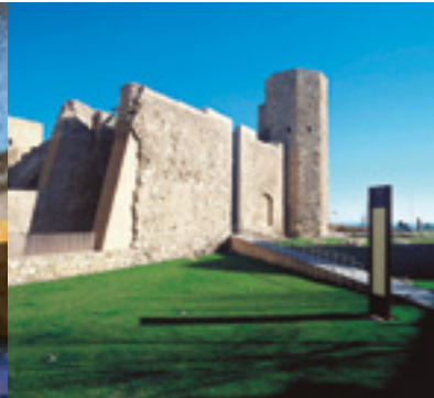
Tours du cirque et prétoire