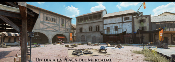
UN DIA A LA PLAÇA DEL MERCADAL