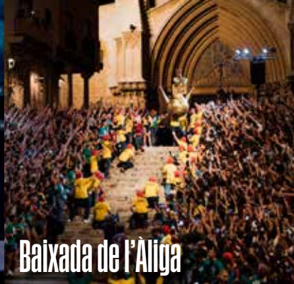
Baixada de l'Àliga