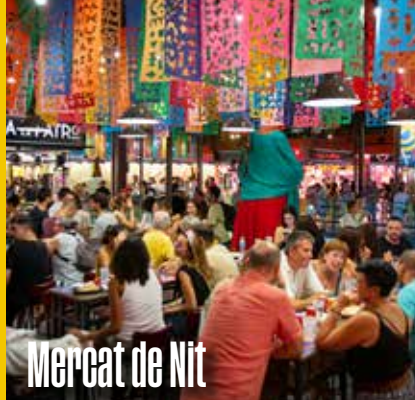
Mercat de Nit