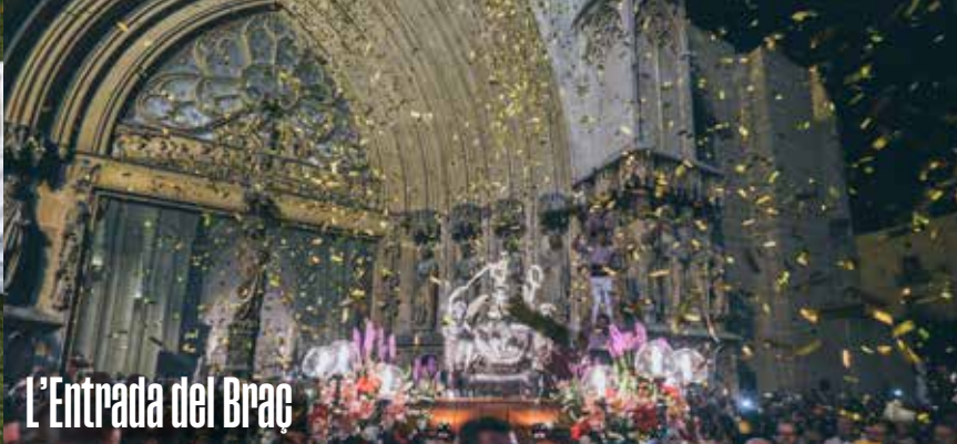
L'Entrada del Braç