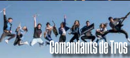
Comandants de Tros