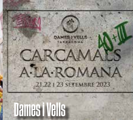
Dames i Vells