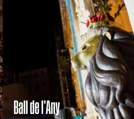
Ball de l'Any