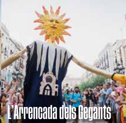
L'Arrencada dels Gegants