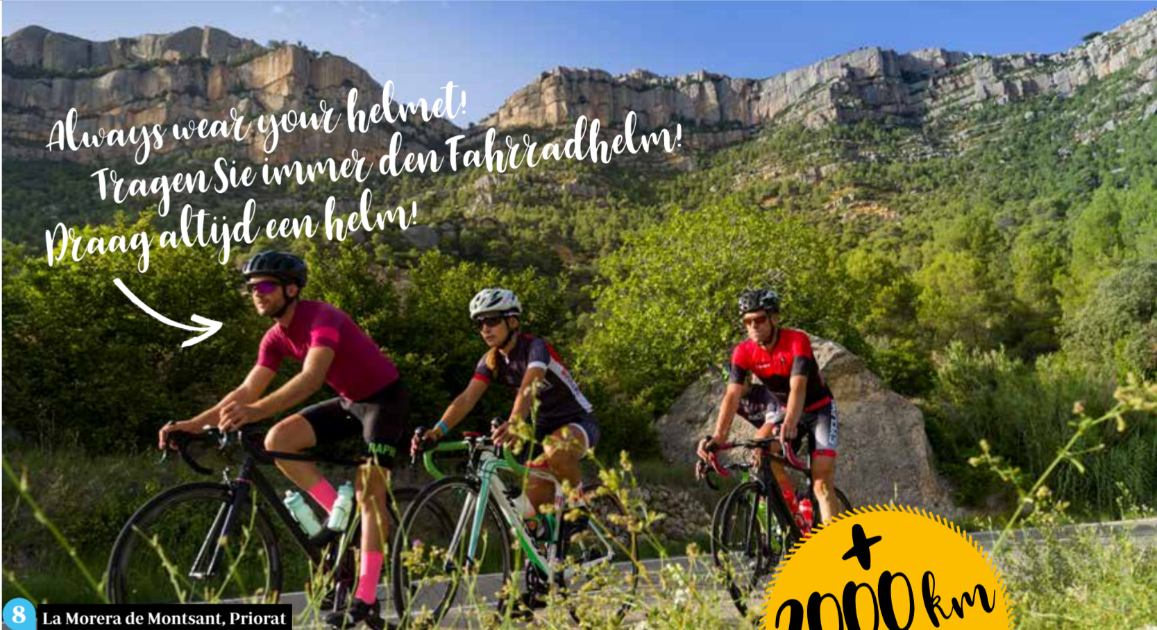
La Morera de Montsant, Priorat 8

Aan de Costa Daurada beleeft u een unieke vakantie met activiteiten in het binnenland en aan de kust.