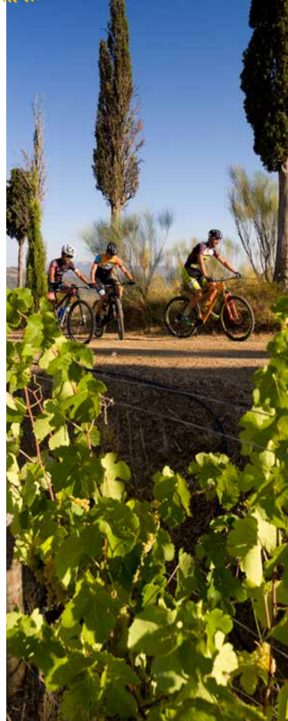
Gatallops, Priorat 3