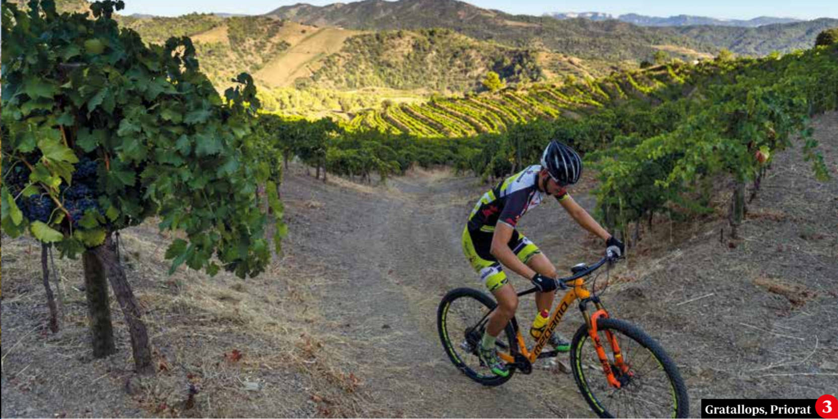
Gatallops, Priorat 3